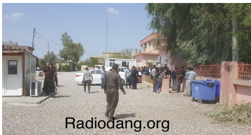
بە وىنە كۆبونەۋەى كاسبكاران بۆ پىدانى فۆرمى رىگەپىدان