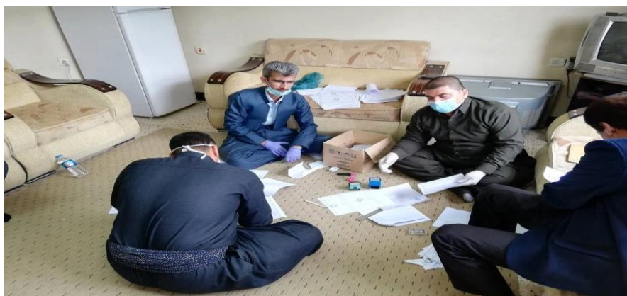
دىمەنىك لە فەرمانبەرانى بەرپۆبەرايەتى كشتوكال بۆ پىدانى فۆرمى رىگەپىدان بە جوتياران

بەھۆى نەبۈنى داتا و زانىارى ورد لەسەر كاسبكاران و پىشەۋەران و جوتياران، لە كاتى دەرچۈنى بىپارەكانى قەدەغەكردنى ھاتوچۆ و رىگىرى كردن لە ھاتوچۆى ھاۋلاتيان، لە بەردەم چەند دەزگايەك رۆژانە كاسبكاران و جوتياران كۆدەبونەۋە بۆ ۋەرگرتنى فۆرمى رىگەپىدان. ۋەك رادىۆى دەنگ لە راپۆرتەكانى دا رومالى كرىبون، بەگشتى گلەبىيان لەۋدەكرد كە پىشتەر ئامادەكارى بۆ ئەو رىكارانە نەكراۋە و پىدانى مۆلەتېشيان بەھۆى قەرەبالەغىيەۋە كاتىكى زۆرى دەۋىست.