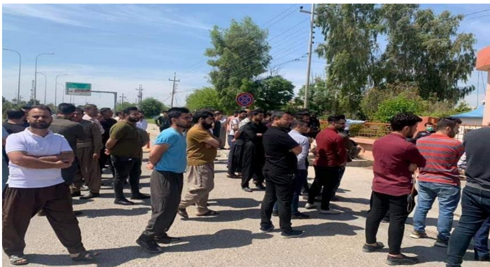
دیمه‌نێک له گ‌ردبونه‌ی کاسبکاران و پیشه‌وه‌ران له به‌رده‌م قایمقامیه‌تى قه‌زای که‌لار، (16 ی نیشان)

به‌هۆى نه‌بونی دڵنیایی ژيانیان له لایه‌ن حکومه‌ته‌وه، کاسبکاران و پیشه‌وه‌رانى بازارى که‌لار له 16 نیشان گ‌ردبونه‌وه له‌به‌رده‌م قایمقامیه‌تى قه‌زای که‌لار، بۆ ئه‌وه‌ی ریگه‌یان پێبدریت بچنه‌ سه‌ر کاره‌کانیان و کاسبیان ده‌ستپێکه‌نه‌وه.