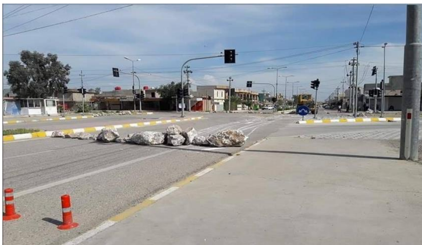
دیمەنیک لە شەقامیکێ قەزای کفری لەکاتی دانانی بەردی گەورە لەبری راگر

لە کاتژمێر ۱۲ نیوہرۆی رۆژی ۴ نیسان بریاری قەدەغەیی ھاوچۆ دەرچو لە تەواي کوردستان، تەنانەت بۆ ئەو کەسانەشی کە مۆلەتیان ھەبو، ھەربۆیە یەکە ئیداریەکانی قەزا و ناحیەکان دەستیان داہە دانانی راگر لەسەر شەقامەکانی گەرمیان . ئەوێ جیگەیی سەرنج بو لەم رووہ، دانانی بەردی گەورە لەناو شەقامەکانی قەزای کفری بو، کە سیمایەکی ناشرینی بە پرۆسەکە و شەقامەکانیش بەخشی بو .